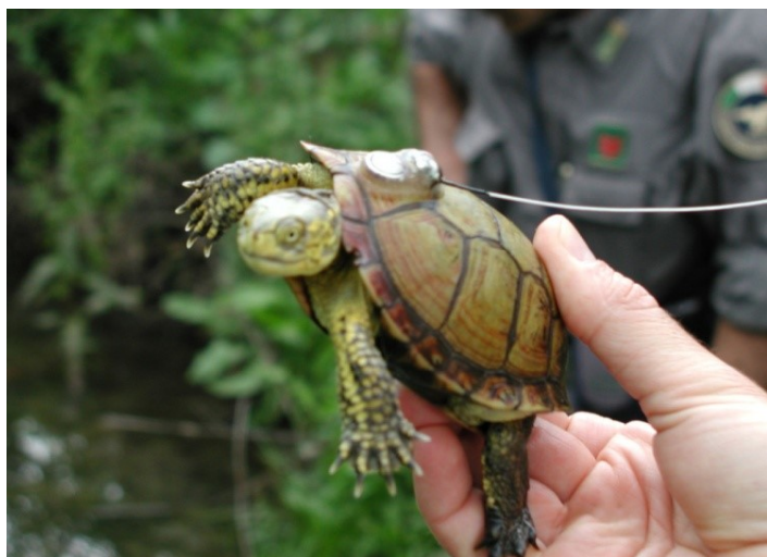
Figura n. 1: Esemplare di Emys orbicularis ingauna