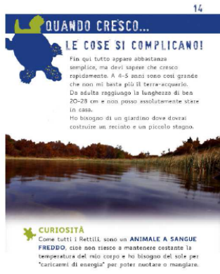
Figura n. 2: Il libretto educativo per le scuole

L'esperienza e i risultati delle attività educative condotte sono state rappresentate nel Report finale delle attività educative svolte . L'attività di divulgazione sulla rimozione delle testuggini alloctone ha aumentato la consapevolezza del pubblico sugli impatti delle specie alloctone sugli ecosistemi e ha sicuramente contribuito all'applicazione del Regolamento UE 1143/2014 , recante disposizioni volte a prevenire e gestire l'introduzione e la diffusione delle specie esotiche invasive. I risultati del progetto e le attività condotte sono state prese ad esempio per l'elaborazione di due nuovi progetti comunitari ed è stato redatto un protocollo di gestione di Emys orbicularis pubblicato sul Global Re-introduction Perspectives (2016, Case-studies from around the globe) del IUCN/SSC Re-introduction Specialist Group (RSG).