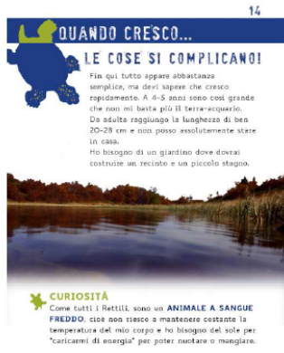
Figura n. 2: Il libretto educativo per le scuole

L'esperienza e i risultati delle attività educative condotte sono state rappresentate nel Report finale delle attività educative svolte . L'attività di divulgazione sulla rimozione delle testuggini alloctone ha aumentato la consapevolezza del pubblico sugli impatti delle specie alloctone sugli ecosistemi e ha sicuramente contribuito all'applicazione del Regolamento UE 1143/2014 , recante disposizioni volte a prevenire e gestire l'introduzione e la diffusione delle specie esotiche invasive. I risultati del progetto e le attività condotte sono state prese ad esempio per l'elaborazione di due nuovi progetti comunitari ed è stato redatto un protocollo di gestione di Emys orbicularis pubblicato sul Global Re-introduction Perspectives (2016, Case-studies from around the globe) del IUCN/SSC Re-introduction Specialist Group (RSG).