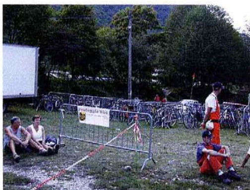
Posteggio biciclette presidiato

Inoltre, grazie ad un accordo con Trenitalia, a tutti gli spettatori che sono arrivati a Sedico in treno da tutte le stazioni della Regione Veneto è stato offerto lo sconto del 50% sul prezzo del biglietto ferroviario con la formula già sperimentata dal PNDB "tu paghi l'andata, noi ti regaliamo il ritorno": era sufficiente comperare un biglietto di sola andata per Sedico, lo stesso era valido anche per il ritorno con un timbro del Parco che attestava la partecipazione all'iniziativa.