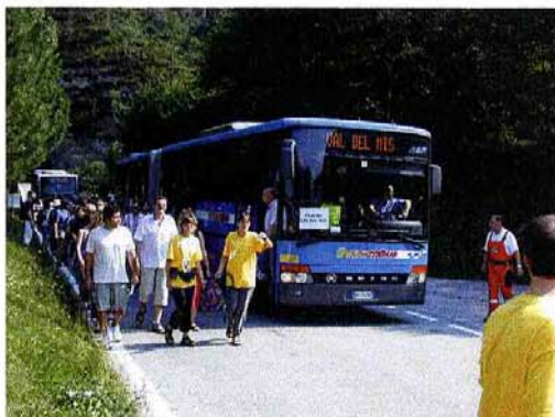
L'arrivo delle prime navette