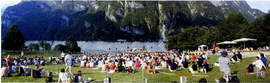
Lo spettacolo in Val del Mis

Nell'Anno Internazionale dell'Acqua e nell'ambito delle iniziative per il proprio decennale, Domenica 3 Agosto, in Piana Falcina - Val del Mis - Sospirolo (BL) - il Parco Nazionale Dolomiti Bellunesi ha organizzato uno spettacolo teatrale con Marco Paolini e i Mercanti di Liquori: “Song n. 32 – Concerto Variabile”.