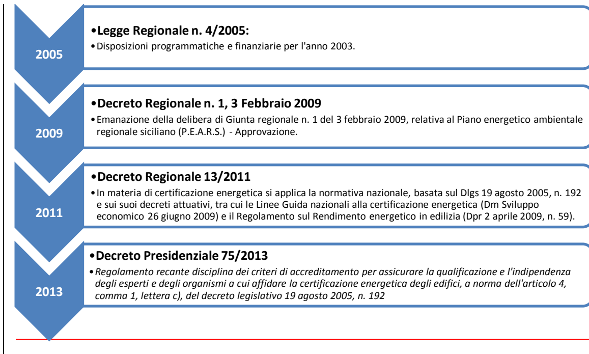
FIGURA 2: PANORAMICA SULLA REGOLAMENTAZIONE IN MATERIA DI EFFICIENZA ENERGETICA NELLA REGIONE SICILIA

Nella Figura 2 sono cronologicamente evidenziati i principali provvedimenti.