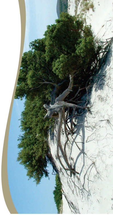
Juniperus oxycedrus subsp. macrocarpa

sono accumuli di sedimenti che si formano sui litorali in seguito all'azione prevalente dei venti, spesso combinata con l'azione delle onde di tempesta dal mare e con gli eventi alluvionali da terra. I sedimenti provenienti dalla spiaggia o da corsi d'acqua limitrofi possono essere trasportati dal vento e accumulati nel retro spiaggia, formando depositi, chiamati campi dunali, le cui dimensioni possono variare da pochi metri a diversi chilometri quadrati, raggiungendo in alcuni casi altezze di oltre dieci metri. Questi ecosistemi, poveri di nutrienti e sferzati da venti salmastri, vengono comunque popolati da specie vegetali (alcune delle quali rare o a rischio di estinzione) che tendono a disporsi in fasce parallele alla riva. Dopo una prima fascia in cui la vegetazione è assente, incontriamo le specie pioniere annuali, come la Cakile maritima . Via via che ci si allontana dalla riva, compaiono altri tipi di vegetazione erbacea perenne, che contribuiscono a stabilizzare la duna. Sulle dune maggiormente consolidate si instaura una vegetazione costituita da boscaglie in cui predomina il ginepro coccolone ( Juniperus oxycedrus subsp. macrocarpa ). Dal momento in cui la duna si forma (spesso a partire dai resti spiaggiati di Posidonia oceanica e altro materiale organico) e per tutta la sua esistenza, le piante marine e terrestri svolgono un ruolo fondamentale per la sua conservazione.