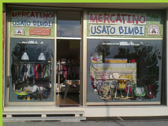
Il negozio "secondamanina" di Thiene

Il sistema di vendita in conto terzi è molto semplice: