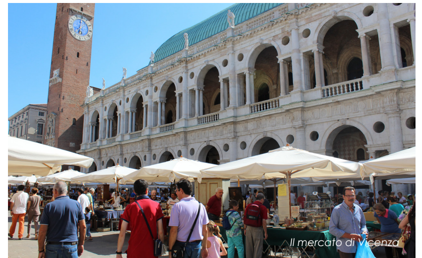
Il mercato di Vicenza