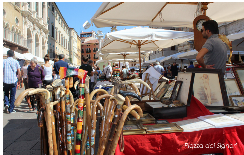
Piazza dei Signori

Espositori: 135 (100 Professionisti; 35 Hobbisti).